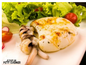
ALFREDI LE PETIT CUISINIER